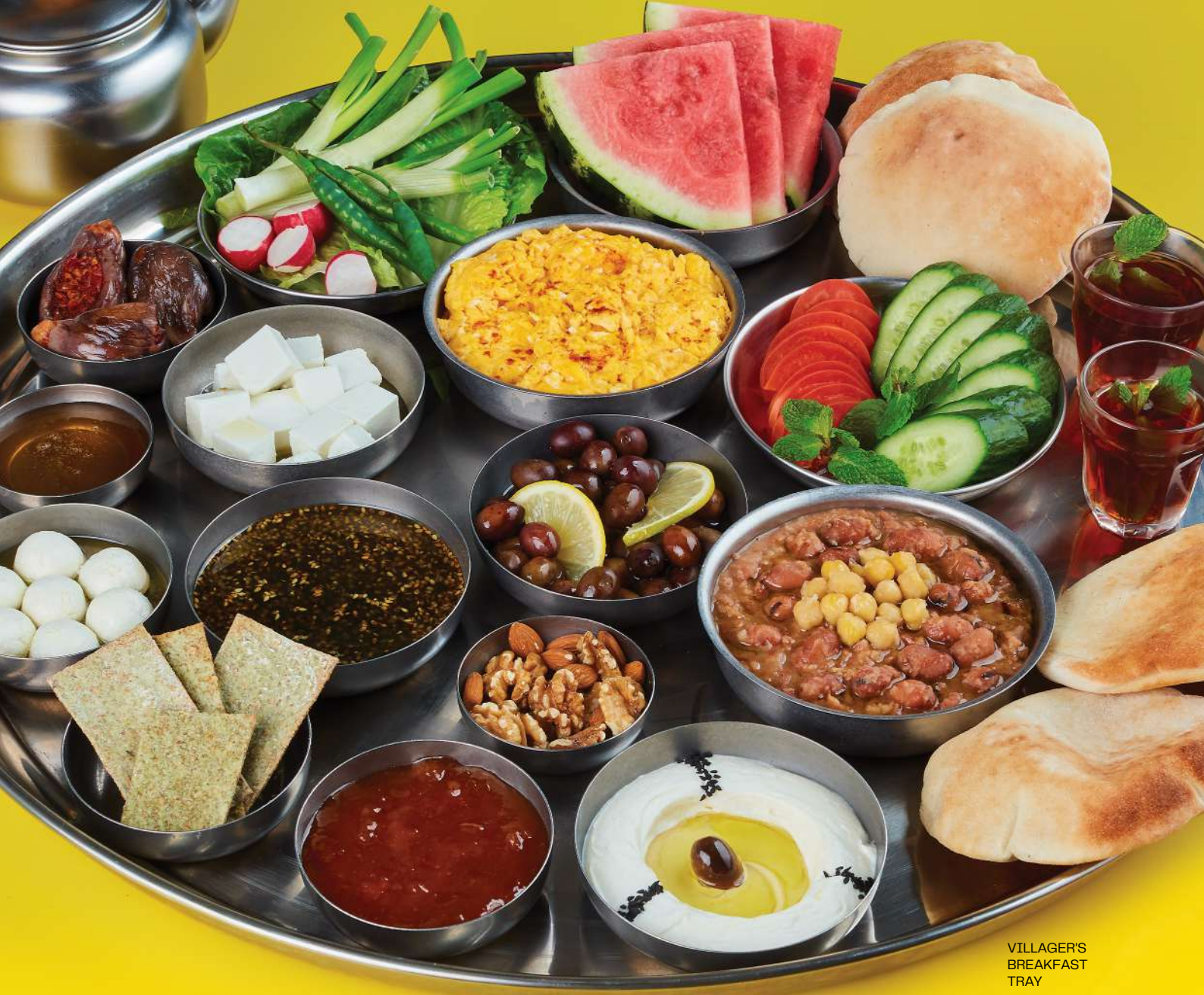
VILLAGER'S BREAKFAST TRAY