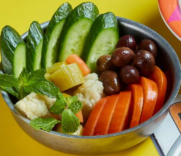
FRESH & PICKLED VEGETABLES PLATE