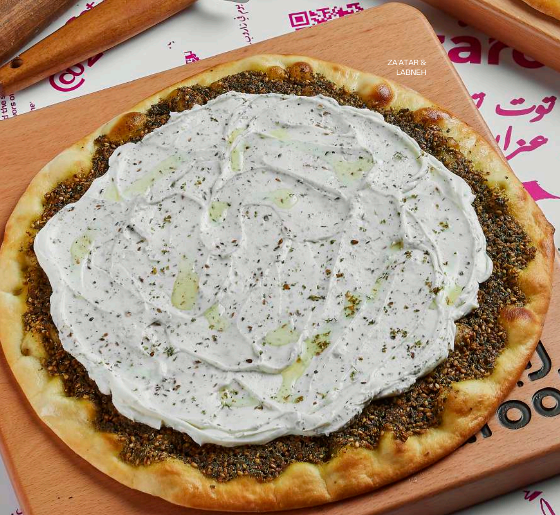
ZA'ATAR & LABNEH