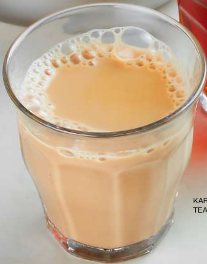
KARAK TEA POT