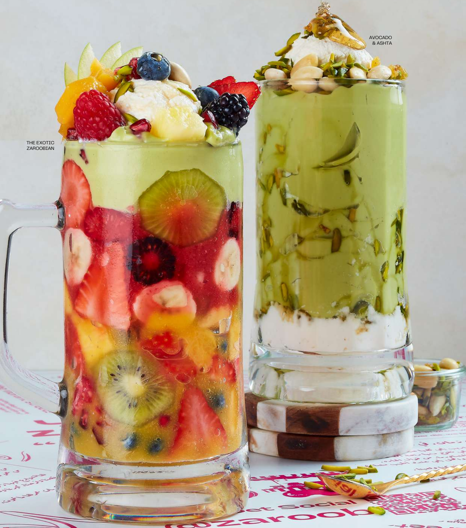
AVOCADO & ASHTA