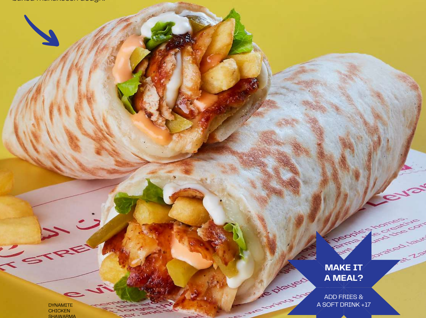
DYNAMITE CHICKEN SHAWARMA

شاورما الدجاج، خس، مخلل الخيار، البطاطس جبنه، صلصة الثوم وصلصة الدايناميت، ملفوفة في عجينة مناقيش مخبوزة طازجاً.