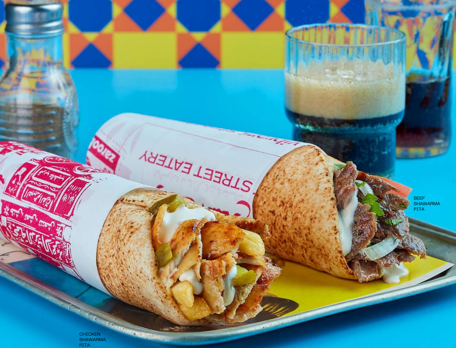
CHICKEN SHAWARMA PITA