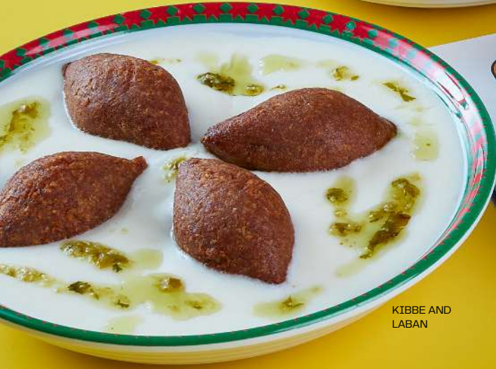
KIBBE AND LABAN