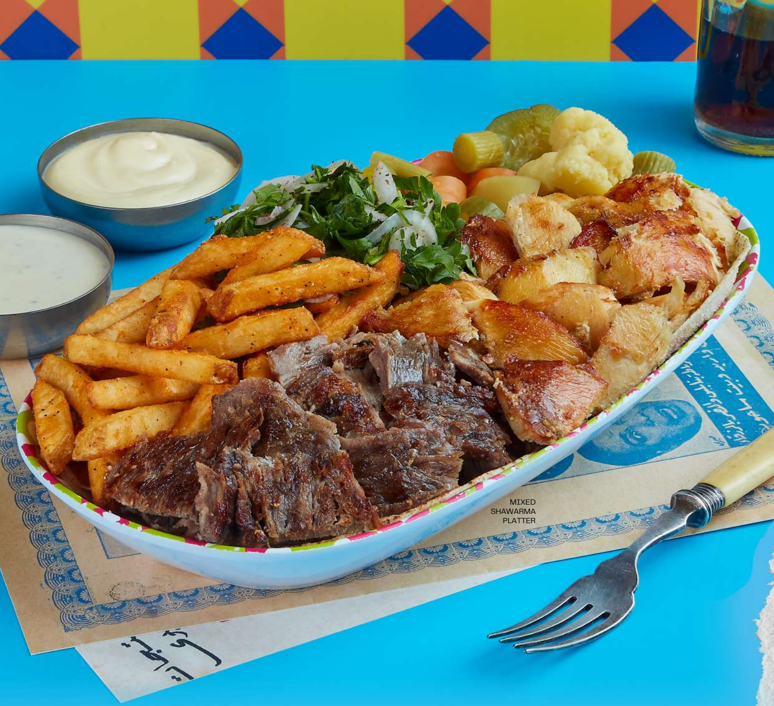
MIXED SHAWARMA PLATTER